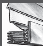
halb ausgefahren abaissé à moitié