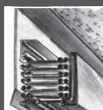
eingefahren retré complètement